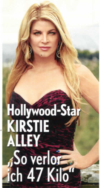
Hollywood-Star KIRSTIE ALLEY „So verlor ich 47 Kilo“

PRINZESSIN MARY Schaffen die Dänen die Monarchie ab?