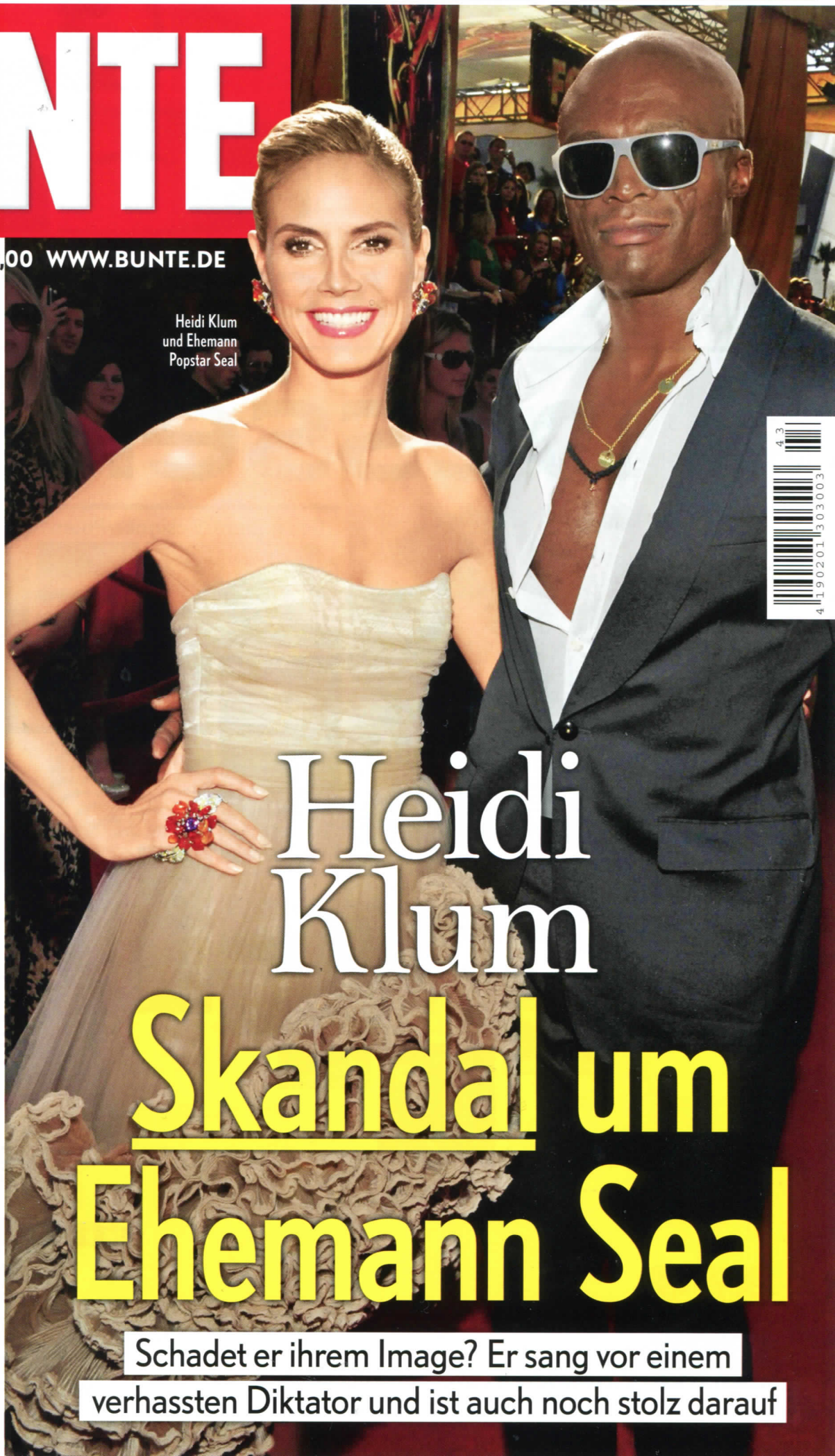
Heidi Klum und Ehemann Popstar Seal

Weltstar UTE LEMPER Blitzhochzeit & Baby mit 48